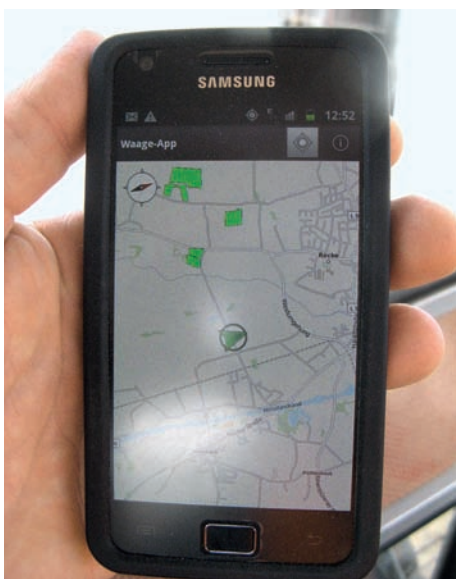
Fa. Claas stellte zwei Smartphones mit verschiedenen Anwendungen zur Verfügung, hier die Waage-App.

Während des Tests wurde aufgrund der Positionsungenauigkeit des Smartphone-GPS einmal bei der Vorbeifahrt ein bereits abgeernteter Schlag identifiziert. Die Anwendung war jedoch in der Lage, die Fehlerinterpretation selbstständig zu korrigieren. Bei der Zuordnung konnten Herkunft und Wiegeergebnis in einem einzigen Fall nicht in Einklang gebracht werden, da diese Wiegung manuell durchgeführt wurde.